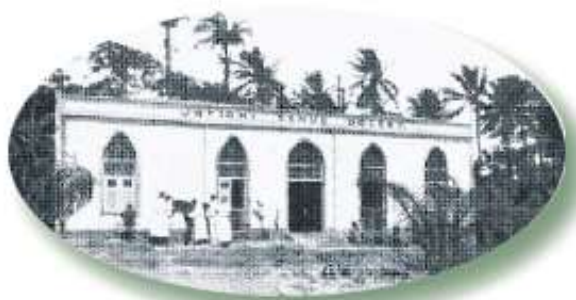
1º Hospital Veterinário do Brasil - Olinda - PE

04/07/1913), ambas na cidade do Rio de Janeiro. A essas Escolas Públicas associou-se a criação da Escola Agrícola e Veterinária do Mosteiro de São Bento de Olinda (1912), em 15 de novembro de 1911 por iniciativa do Abade D.