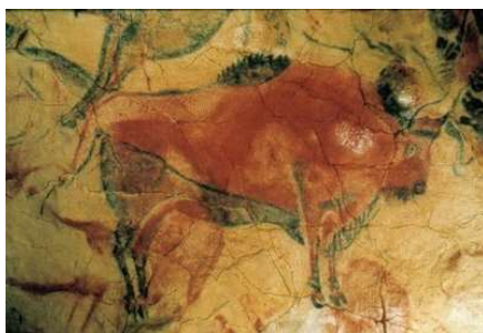
Figura 1 - Bosprimigenius Caverna de Altamira - ESP.