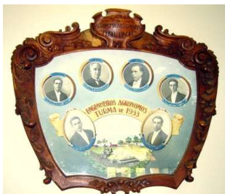
Quadro de Formatura dos Agrônomos da Turma de 1933 da Escola de Agronomia Eliseu Maciel, da UFPel/RS.)

A Medicina Veterinária moderna, que recentemente, festejou 250 anos de existência foi organizada a partir de critérios científicos, desde o surgimento da primeira escola de Medicina Veterinária do mundo, em Lyon-França, criada pelo hipologista e advogado francês Claude Bourgelat, que foi assim definido por historiadores franceses: “Claude Bourgelat, né à Lyon le 11 novembre 1712, mort le 3 janvier 1779, est un vétérinaire français” . A Escola foi criada por Édito Real, promulgado pelo Rei Luiz XV de Bourbon – o Bem Amado, em 04 de agosto de 1761, iniciando seu funcionamento com oito estudantes, em 19 de fevereiro de 1762, sendo considerado o primeiro Curso formal do ensino em Medicina Veterinária.