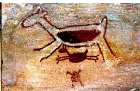
Figura 2 - Arte rupestre - símbolo do Parque Nacional da Serra da Capivara / Piauí.

A Medicina Veterinária na antiguidade - No período Neolítico entre 8.000 e 3.000 a.C. os homens domesticaram os animais e aprenderam a criá-los, usando-os como fonte de alimentos, para serviços e como produtores de materiais de uso cotidiano. Nessa convivência os pastores ou protetores dos animais e das criações passaram a tratá-los na ocorrência das enfermidades. E, ao final desse Período, já existiam algumas civilizações que dominavam a escrita. Atribui-se aos Sumérios o desenvolvimento de um tipo de escrita, chamada cuneiforme.